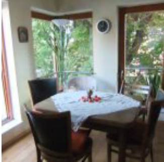
Raum für die Kollegiumssitzung