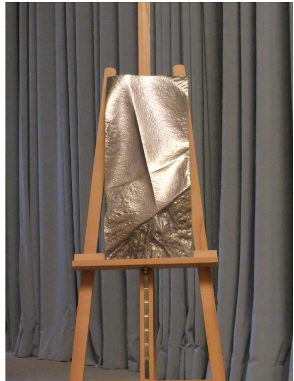
„Zu Michaeli“, Relief von Peter Goehlen (Koblenz), Edelstahlblech getrieben, 2008

am 29. September 2018, 14.30 – 18.30 Uhr im Rudolf Steiner Haus Frankfurt